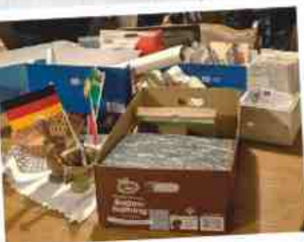
Archivarbeit unter fachlicher Begleitung