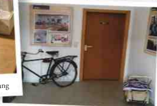
Depot Alte Vogtei mit 4000 Exponaten