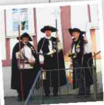
Führungen im und ums Dorf