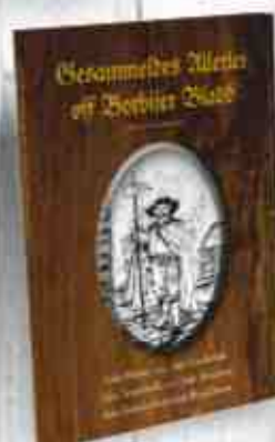
„Borbijer Bladd“ dokumentieren und sichern