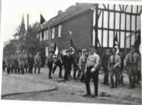
Unterm Hakenkreuz – Burbach 1933 – 1945

Zu Jahresbeginn hat der Heimatverein die Projektgruppe „Burbacher Geschichtswerkstatt“ installiert, die derzeit aus bislang Engagierten besteht und sich erweitern soll. Die Projektgruppe hat zum Ziel, das Konzept der „Burbacher Geschichtswerkstatt“ zu erarbeiten und setzt dabei auf der Beteiligung und Mitwirkung interessierter Bürgerinnen und Bürger. Über die Projektarbeit wird zur Jahresmitte ein Zwischenbericht erstellt. Angestrebt ist der Abschluss der Konzepterstellung für das Jahresende 2025 mit einer öffentlichen Präsentation. Wir freuen uns und sind dankbar, dass die Stiftung der Sparkasse Burbach das Projekt „Burbacher Geschichtswerkstatt“ unterstützt und fördert.