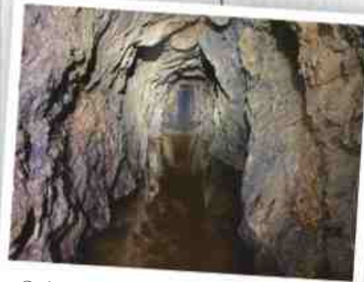
„Grube Schöne Aussicht“ als frühes Bergbaurelikt